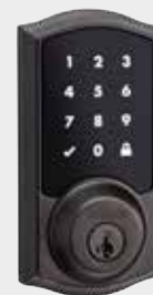
9GED21000-003 Venetian Bronze Prix courant 420 $