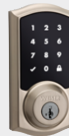
9GED21000-002 Nickel Satin Prix courant 420 $